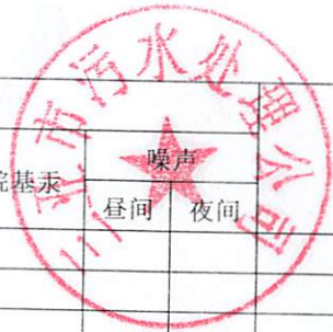
三亚市污水处理公司新城水质净化厂2019年3月份自行监测结果统计表