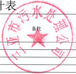
三亚市污水处理公司红沙污水处理厂2019年3月份自行监测结果统计表